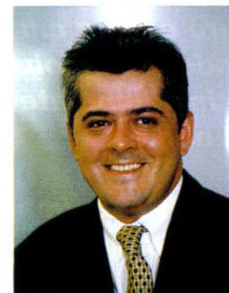
Guerra: consolidação ainda neste ano

O objetivo da StarMedia é atrair o maior número possível de visitantes, para poder vender espaço a anunci-